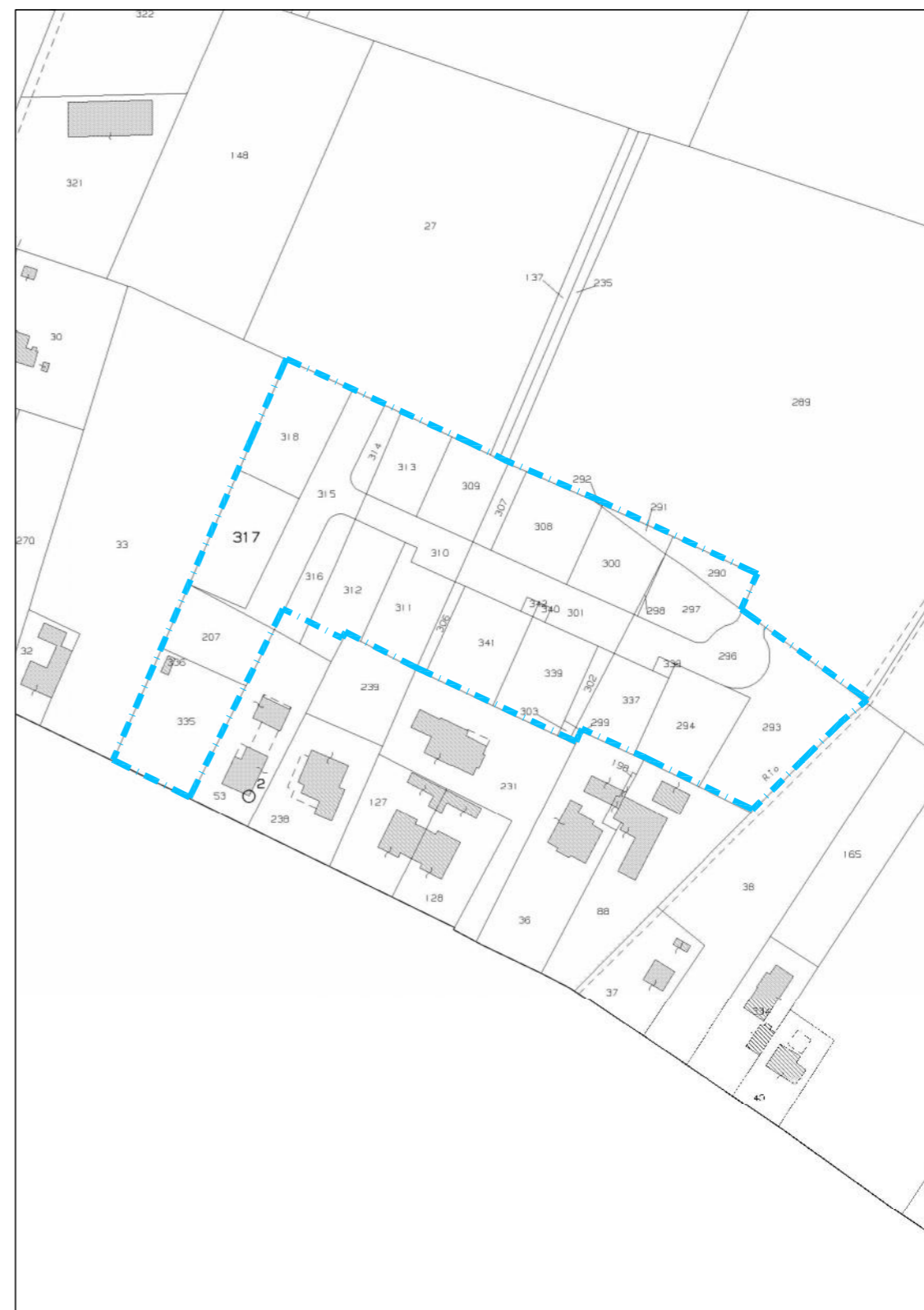
Estratto di mappa del comune di Sesto al Reghena Foglio 28 mappali 335, 336, 207, 317, 318, 315, 314, 316, 313, 310, 312, 309, 311, 307, 306, 292, 308, 341, 342, 340, 291, 300, 301, 339, 302, 303, 290, 297, 298, 296, 338, 337, 299, 294, 293, scala 1:2000