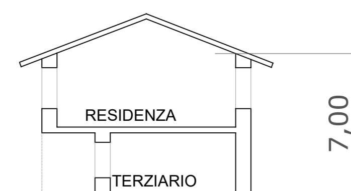
SEZIONE SU U.M.I. "A - B" 1:200